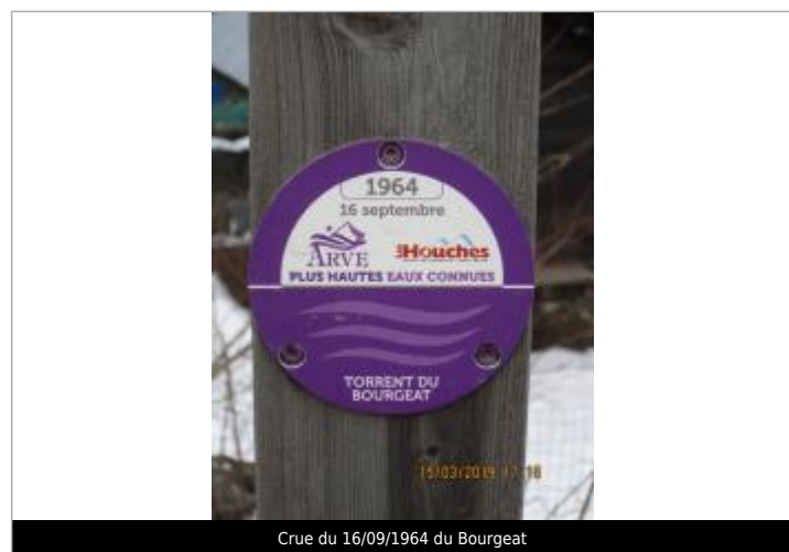
Crue du 16/09/1964 du Bourgeat