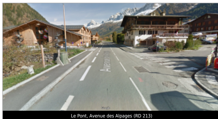
Le Pont, Avenue des Alpages (RD 213)