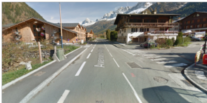
Le Pont, Avenue des Alpages (RD 213)