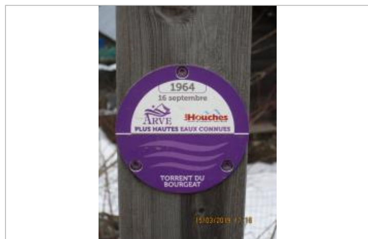
Crue du 16/09/1964 du Bourgeat