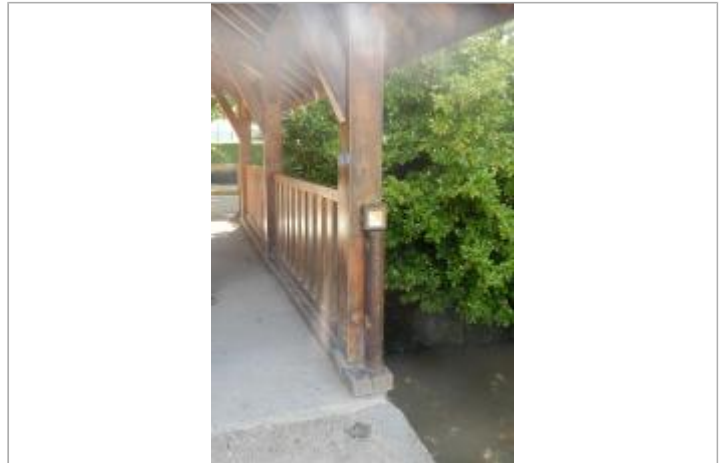
Pont à Journy