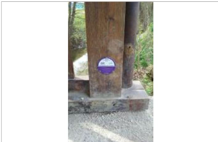
Crue du Foron en juin 1974