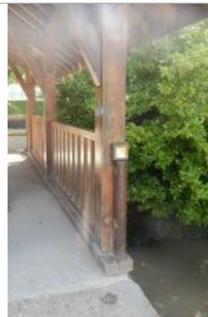
Pont à Journy