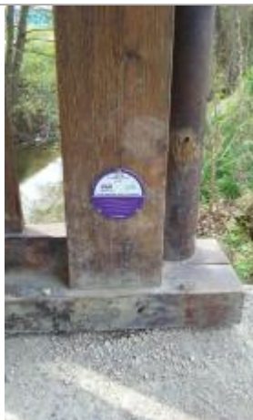
Crue du Foron en juin 1974