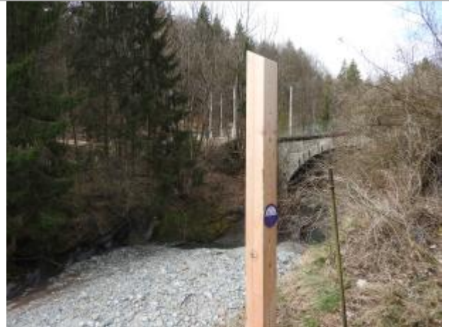
Sentier des Lanternes à Servoz