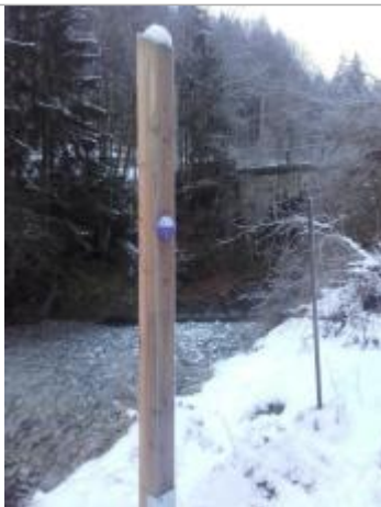
Crue de l'Arve le 26/08/2014, à Servoz (Sentier des Lanternes)