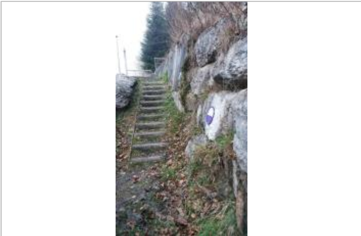
Escalier du Vernand

GÉOLOCALISATION Coordonnées WGS84 : X: 6.23251850 / Y: 46.18311400 Coordonnées RGF93 (Lambert 93) X: 949272.04 / Y: 6569911.79 Coordonnées RGF93 (ETRS89) : X: 6.2325185 / Y: 46.183114 Code Hydro: V0--0200 Rive de référence: Droite