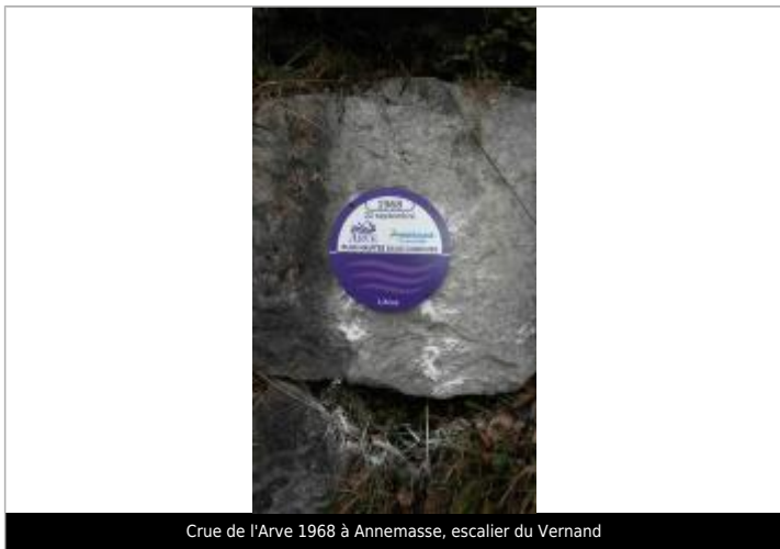
Crue de l'Arve 1968 à Annemasse, escalier du Vernand

Visibilité : Oui État du repère : Bon Pérennité : Longue