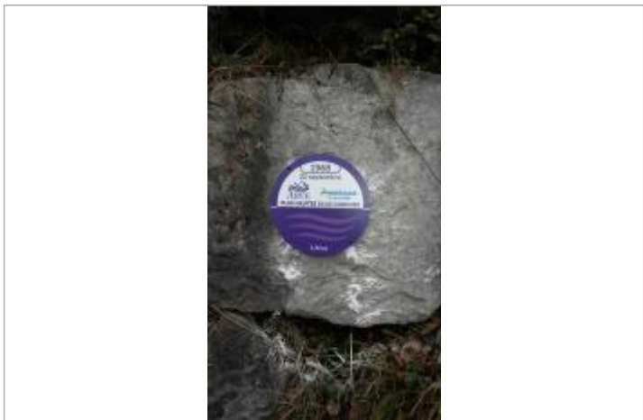
Crue de l'Arve 1968 à Annemasse, escalier du Vernand

MARQUE Visibilité : Oui État du repère : Bon Pérennité : Longue