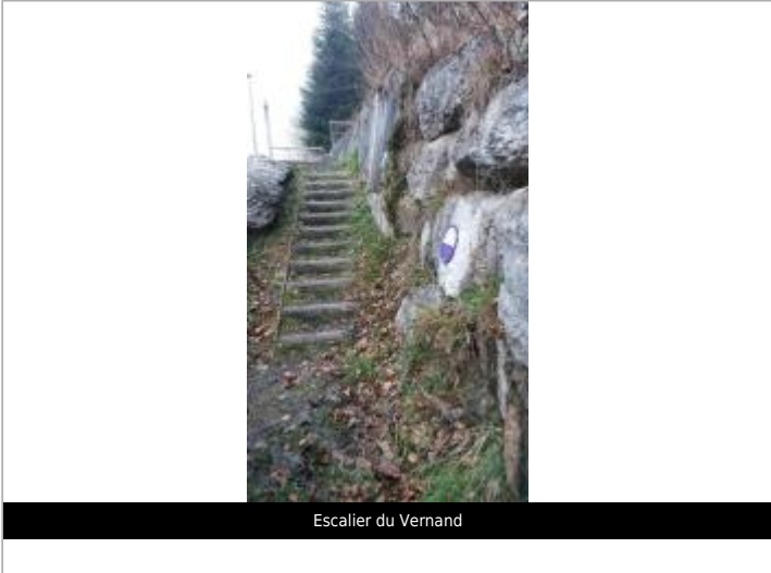
Escalier du Vernand