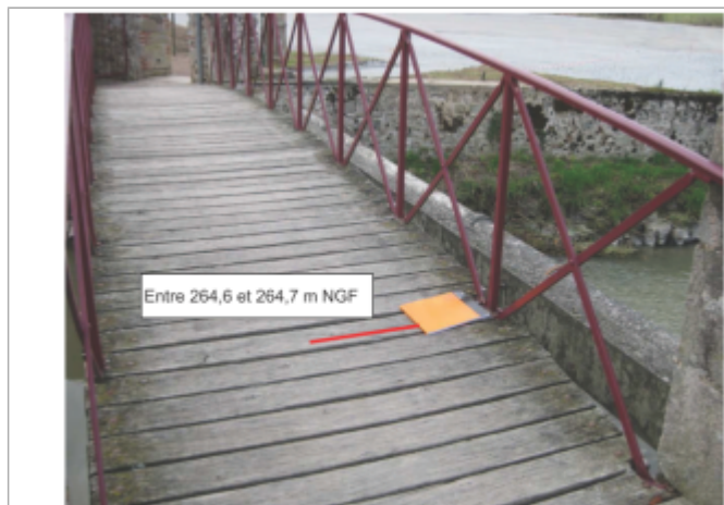
Site et repère

Visibilité : Oui État du repère : Bon Pérennité : Longue