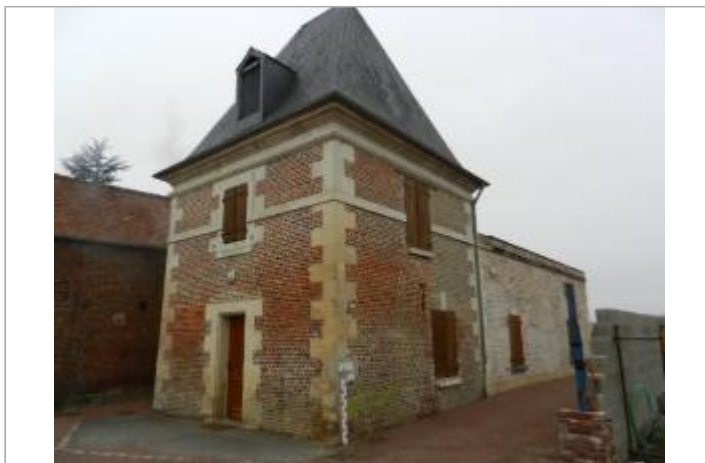
Rue du château Guiscard