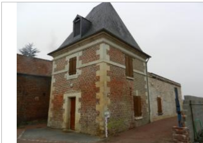
Rue du château Guiscard

Coordonnées WGS84 : X: 3.04695000 / Y: 49.65542260