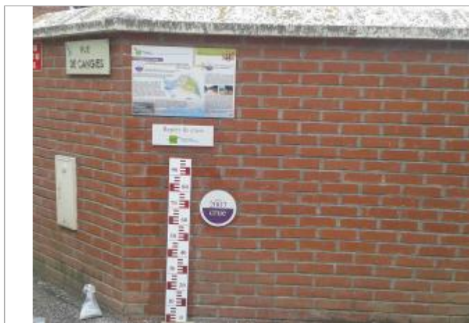
Rue de Cangies Muirancourt