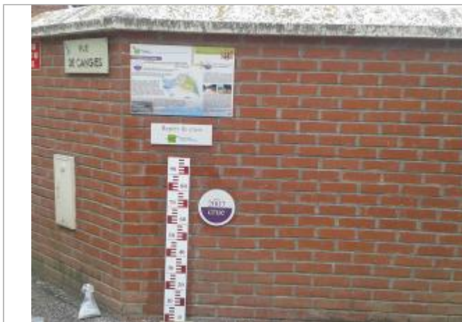
Rue de Cangies Muirancourt

Coordonnées WGS84 : X: 3.01584723 / Y: 49.64435430