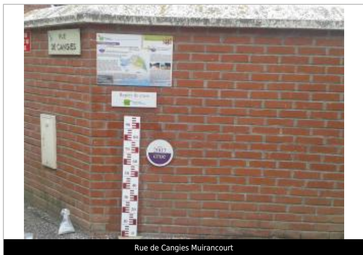
Rue de Cangies Muirancourt

Texte : Crue juin 2007 Visibilité : Oui État du repère : Bon