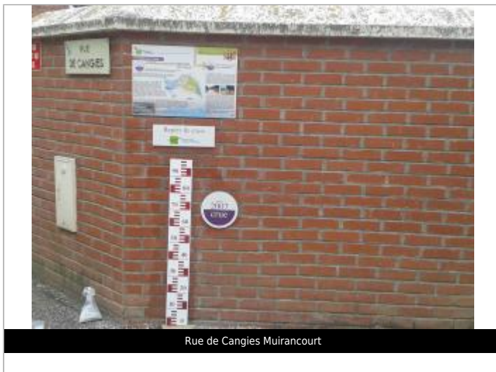
Rue de Cangies Muirancourt