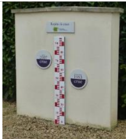
Allée de la Verse Noyon

Coordonnées RGF93 (ETRS89) : X: 2.9899154 / Y: 49.5837542