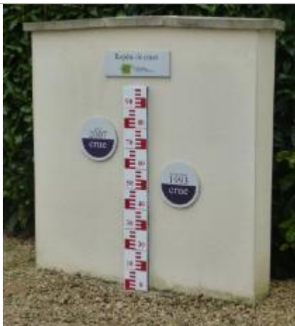
Noyon Allée de la Verse