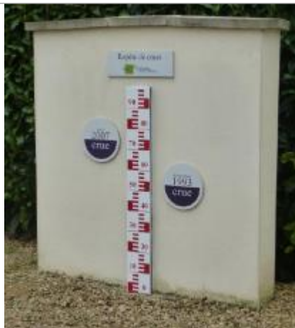
Allée de la Verse Noyon