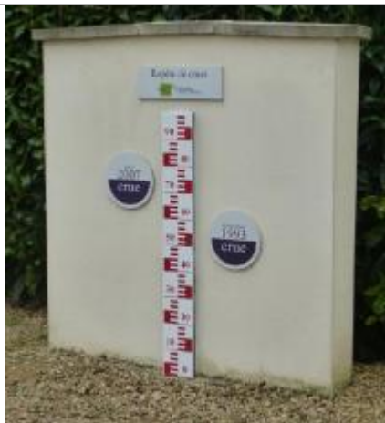
Noyon Allée de la Verse