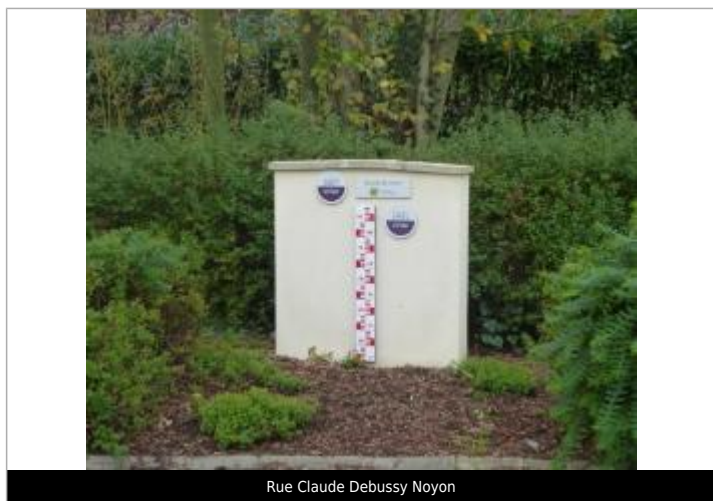
Rue Claude Debussy Noyon

Texte : Crue juin 2007 Maximum de l'inondation : Oui Visibilité : Oui État du repère : Bon Pérennité : Longue