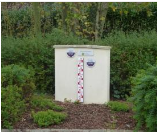
Rue Claude Debussy Noyon