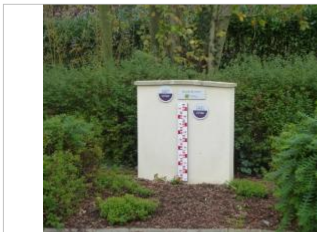
Rue Claude Debussy Noyon