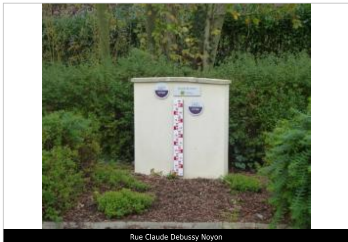
Rue Claude Debussy Noyon

Texte : Décembre 1993 Maximum de l'inondation : Oui Visibilité : Oui État du repère : Bon Pérennité : Longue