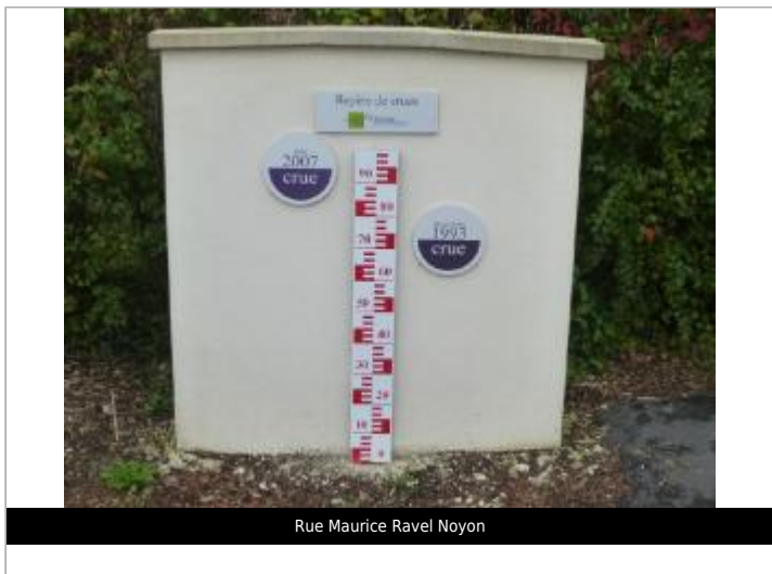
Rue Maurice Ravel Noyon