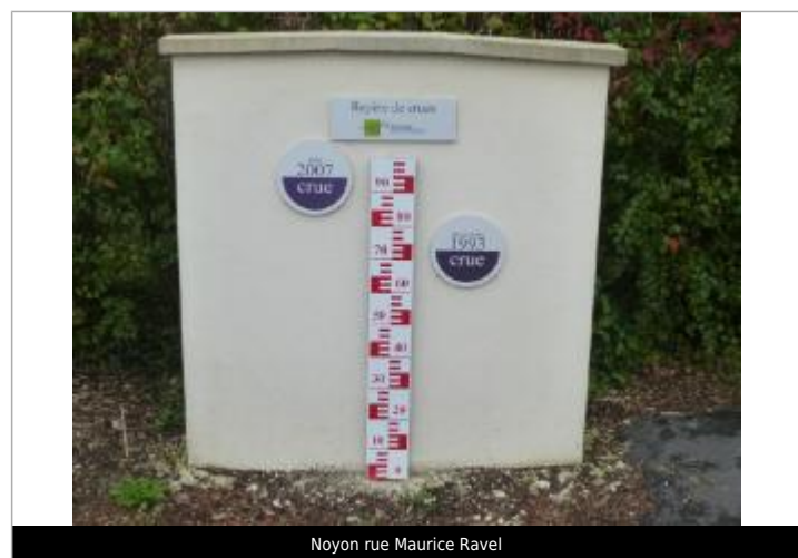
Noyon rue Maurice Ravel

GÉNÉRAL Code : WEB_R_201802075831 Date de mise à jour : 23/06/2021