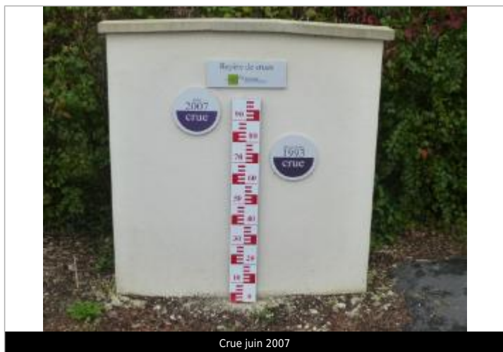
Crue juin 2007