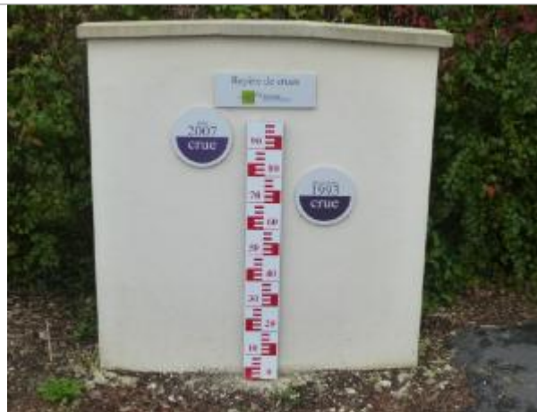
Rue Maurice Ravel Noyon