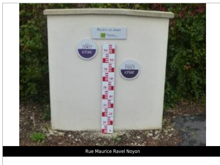
Rue Maurice Ravel Noyon

GÉOLOCALISATION Coordonnées WGS84 : X: 2.99413661 / Y: 49.58282900 Coordonnées RGF93 (Lambert 93) X: 699575.78 / Y: 6942622.02 Coordonnées RGF93 (ETRS89) : X: 2.9941366 / Y: 49.582829 Code Hydro: H0310600 Rive de référence: