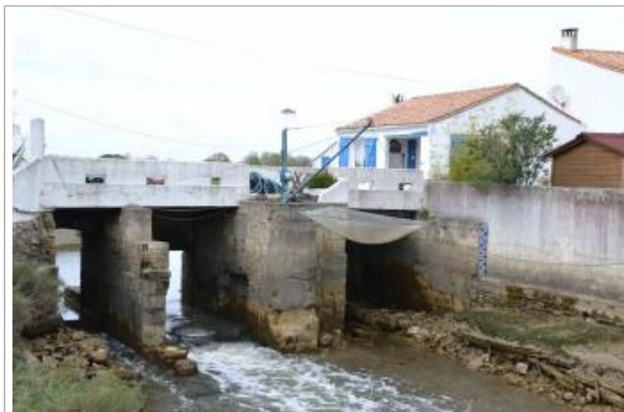
Rue du basse chenal, Plordonnier