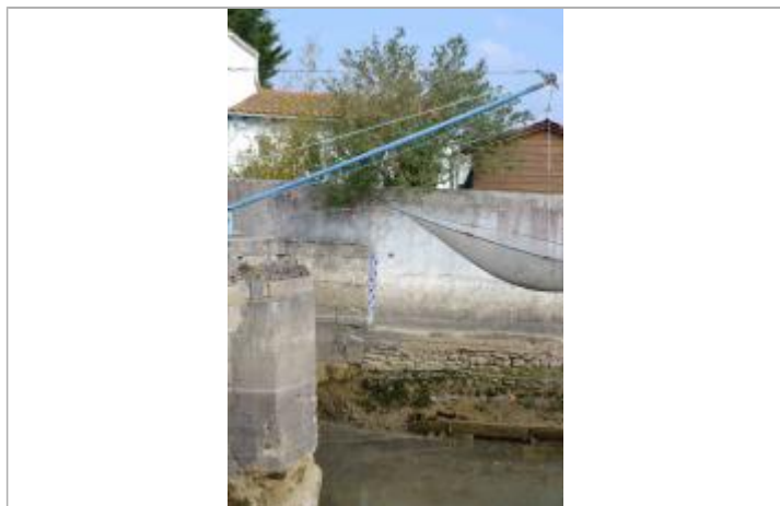
Repère Xynthia, Plordonnier

Texte : Xynthia 2010 Maximum de l'inondation : Oui Visibilité : Oui État du repère : Bon Pérennité : Longue Repère calculé : Oui