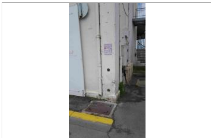
Bâtiment Expo'Seudre, Chenal de La Trembalde

Code : SMBS_R_11_02 Date de mise à jour : 03/05/2023 Auteur : PAPI Seudre