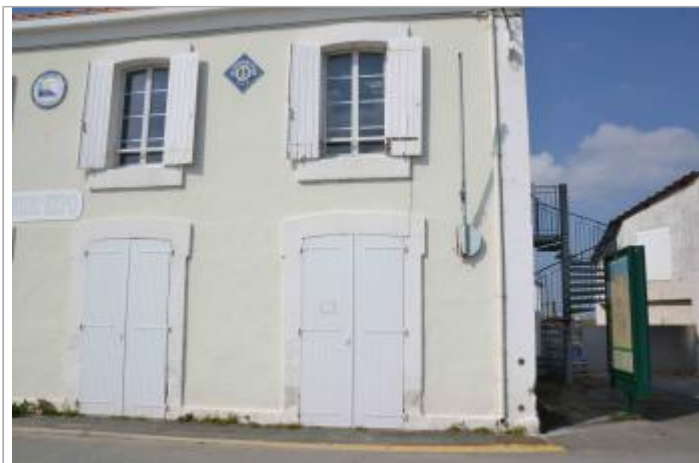
Expo Seudre, Grève de La Tremblade