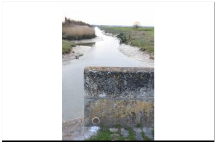
Moulin de Chalons, Le Gua

GÉNÉRAL Code : SMBS_R_02_01 Date de mise à jour : 03/05/2023 Auteur : PAPI Seudre