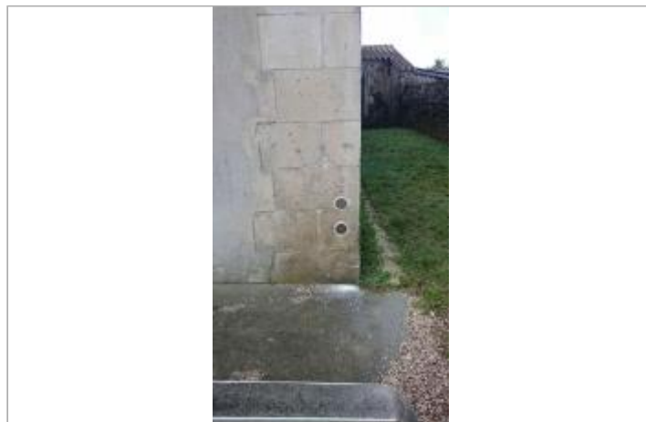
Mur du Temple, l'Eguille

Coordonnées WGS84 : X: -0.97479760 / Y: 45.70728700