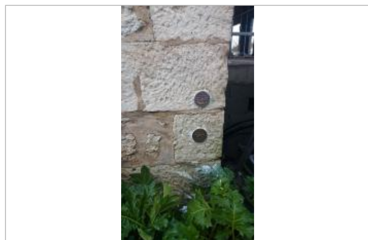
Mur du syndicat d'initiatives, rue du Port

GÉNÉRAL Code : SMBS_R_06_01 Date de mise à jour : 03/05/2023 Auteur : PAPI Seudre