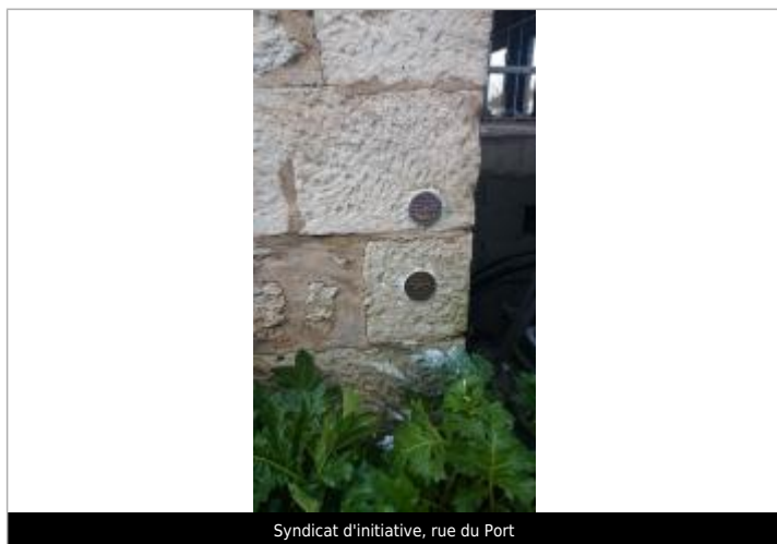
Syndicat d'initiative, rue du Port