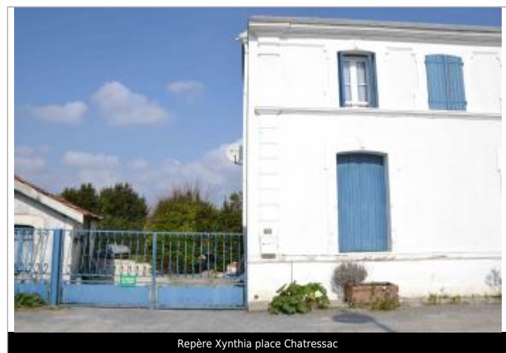
Repère Xynthia place Chatressac

GÉNÉRAL Code : SMBS_R_10_01 Date de mise à jour : 03/05/2023 Auteur : PAPI Seudre