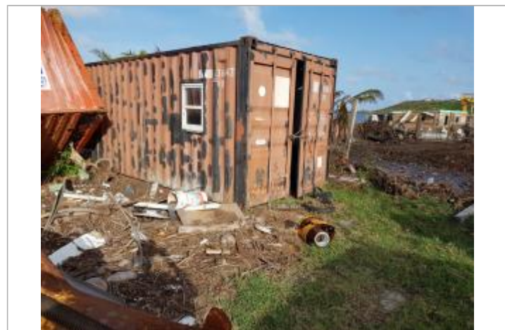
Vue de la PHE - Auteur : Cerema

GÉNÉRAL Code : Cer_IRMA_R_28_1 Date de mise à jour : 10/07/2018 Auteur : Cerema Méditerranée