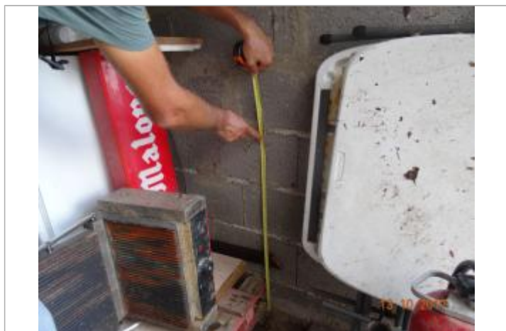
Vue de la PHE

Altitude calculée de l'eau (en m) : 1.95 m