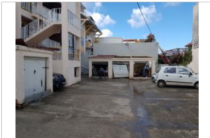
Vue du site - Auteur : Cerema