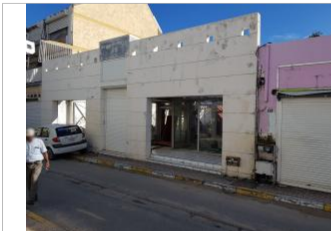
Vue du site - Auteur : Cerema