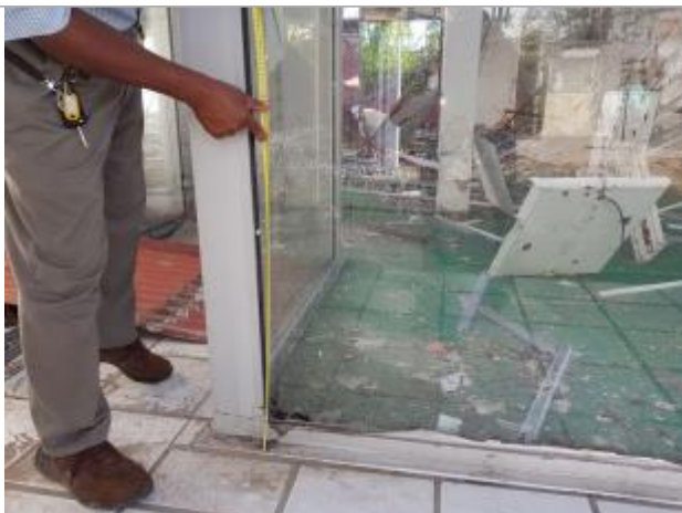
Vue de la PHE

Différence entre le niveau d'eau et la référence (en m) : 0.710 m