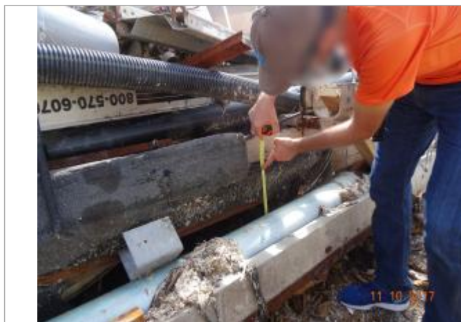
Vue de la PHE

Altitude calculée de l'eau (en m) : 1.44 m