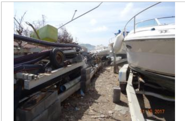
Vue du site - Auteur : Cerema