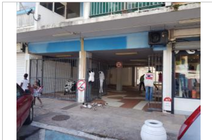
Vue du site - Auteur : Cerema

GÉOLOCALISATION Coordonnées WGS84 : X: -63.08646700 / Y: 18.06458400 (RRAF 91)UTM 20N X: 490849.71 / Y: 1997333.03 Coordonnées RGF93 (ETRS89) : X: -63.086467 / Y: 18.064584 Code Hydro: _OATLANT Rive de référence: Non renseigné