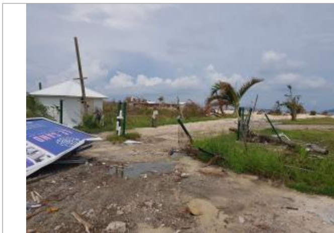
Vue du site - Auteur : Cerema