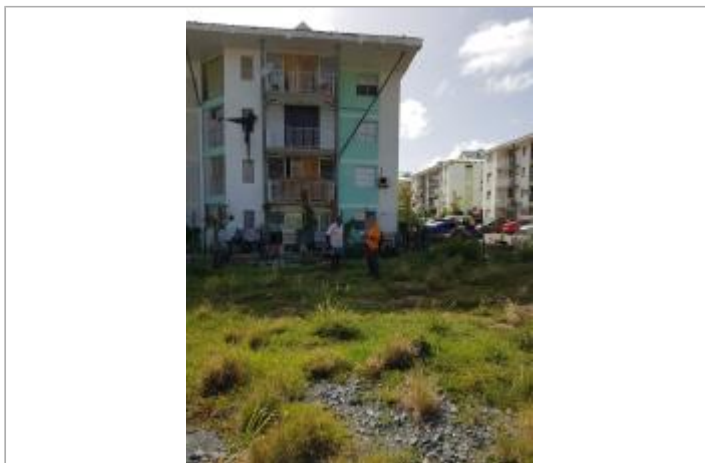
Vue du site - Auteur : Cerema