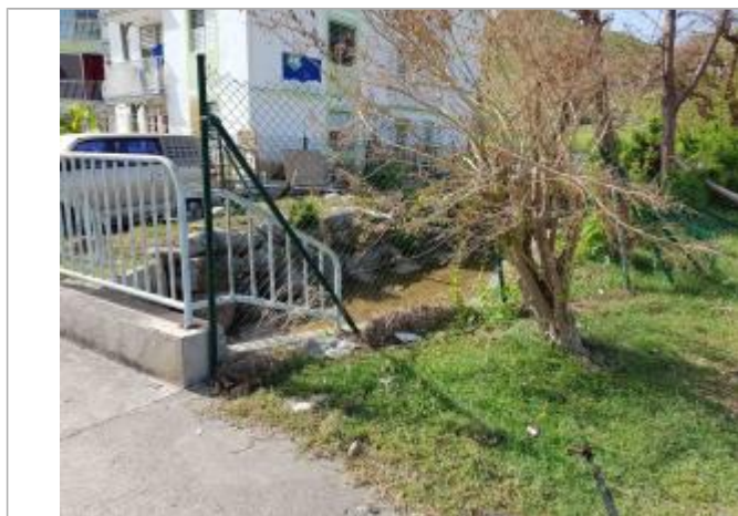
Vue de la PHE

Altitude calculée de l'eau (en m) : 3.63