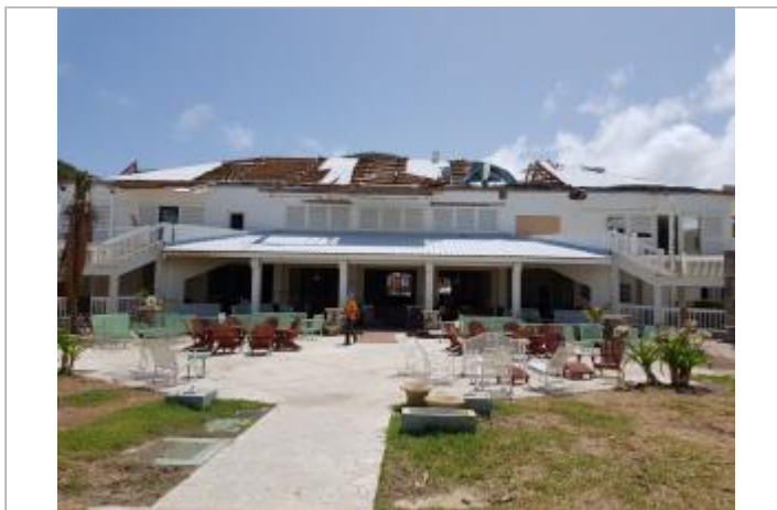
Vue du site - Auteur : Cerema