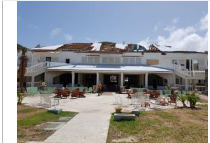
Vue du site - Auteur : Cerema

Coordonnées WGS84 : X: -63.03849800 / Y: 18.11262700