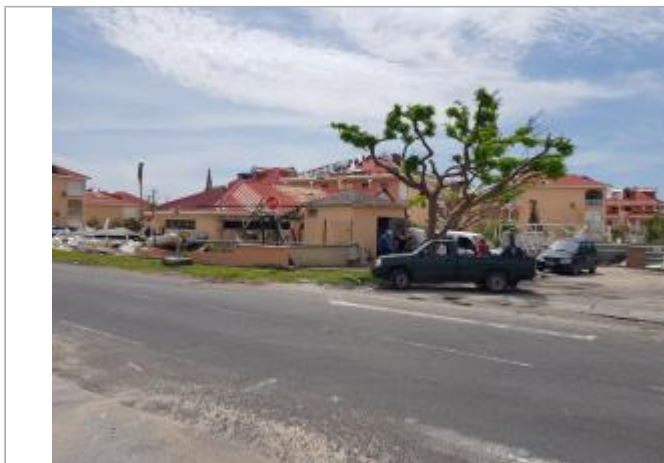
Vue du site - Auteur : Cerema