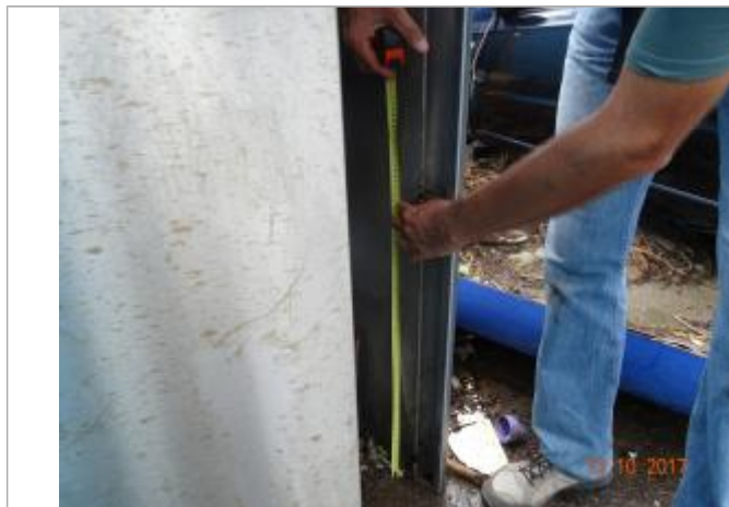
Vue de la PHE

Altitude calculée de l'eau (en m) : 2.65