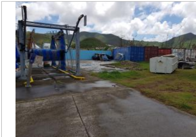
Vue du site - Auteur : Cerema