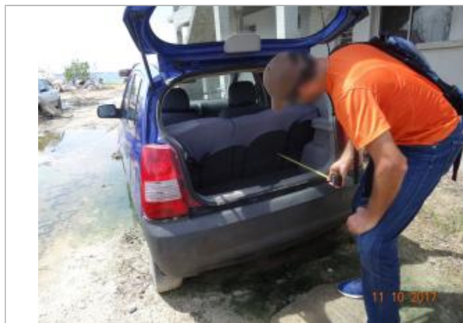
Vue de la PHE - Auteur : Cerema

SOURCE DE REPÉRAGE : CEREMA MISSION IRMA 2 - 15/10/2017