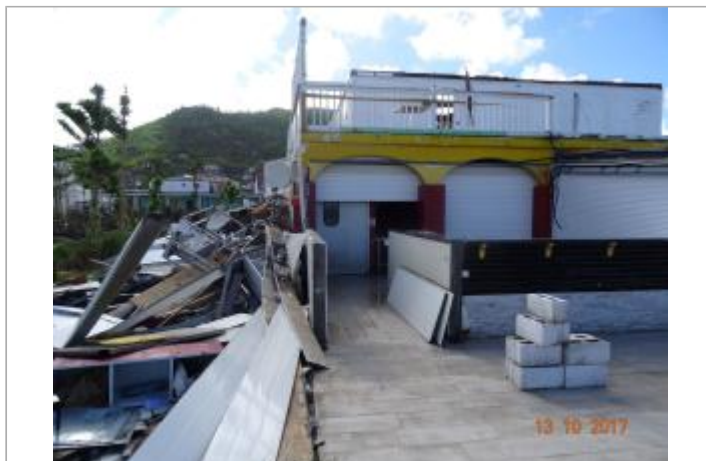
Vue du site - Auteur : Cerema