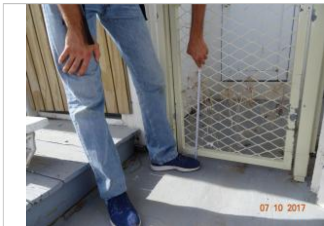
Vue de la PHE

Altitude calculée de l'eau (en m) : 3.55