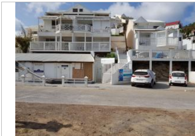
Vue du site - Auteur : Cerema