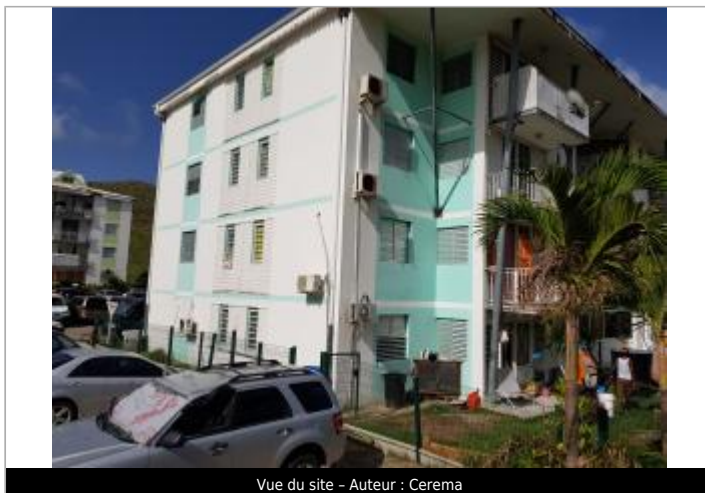
Vue du site - Auteur : Cerema