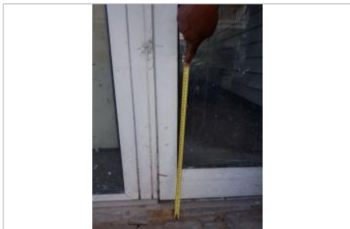
Vue de la PHE

Altitude calculée de l'eau (en m) : 1.86