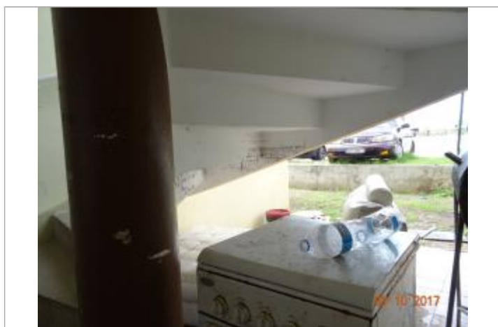
Vue de la PHE - Auteur : Cerema