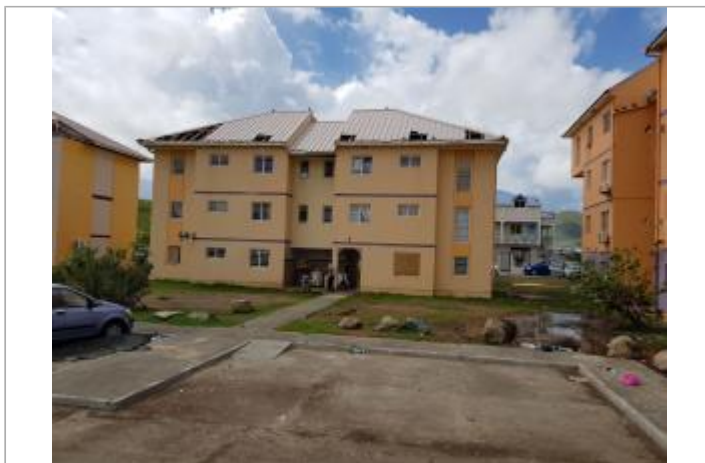
Vue du site - Auteur : Cerema