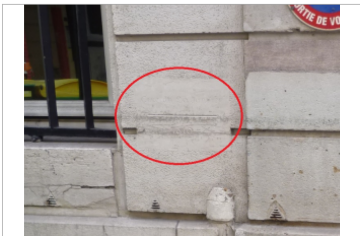
A gauche du porche d'entrée

Maximum de l'inondation : Oui Visibilité : Oui État du repère : Moyen Pérennité : Longue