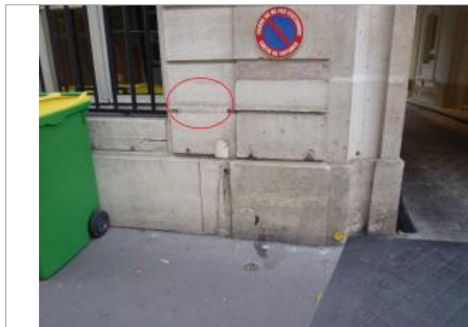
A gauche du porche d'entrée