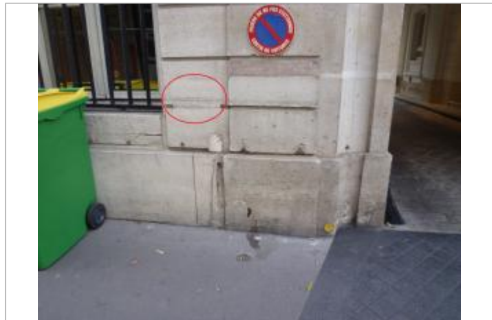
A gauche du porche d'entrée