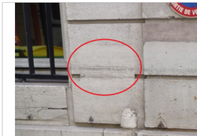
A gauche du porche d'entrée

Maximum de l'inondation : Oui Visibilité : Oui État du repère : Moyen Pérennité : Longue