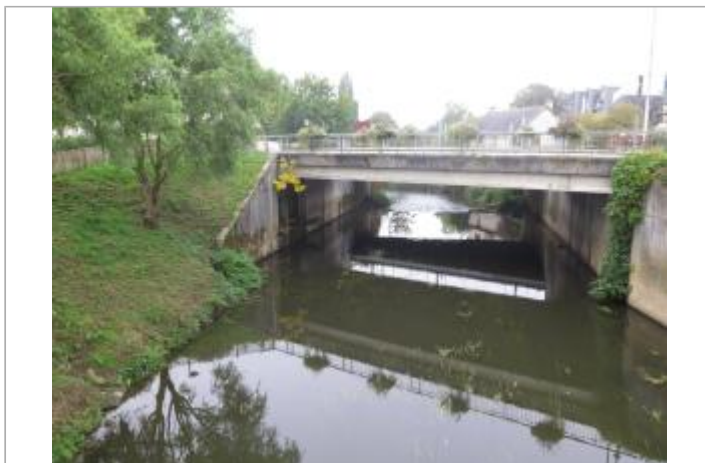
Echelle limnimétrique de la Vilaine à Chateaubourg