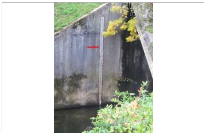
Echelle limnimétrique de la station de Chateaubourg.