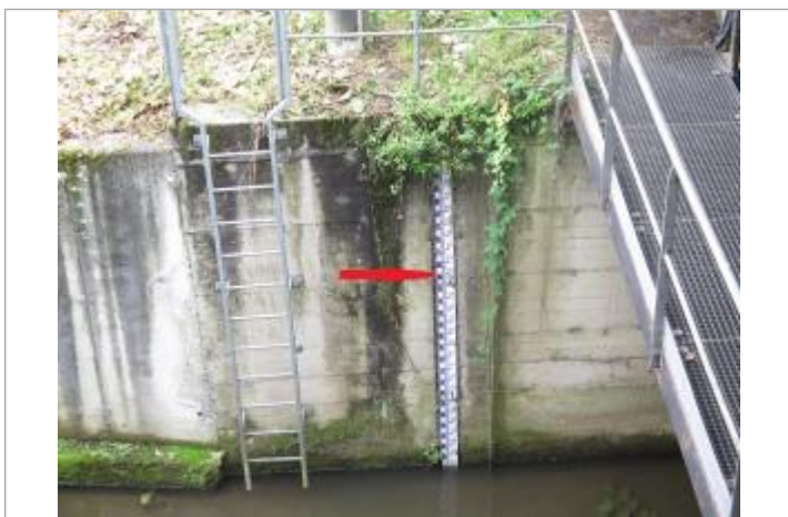
Echelle limnimétrique de la station de Vitré Bas Pont

Altitude calculée de l'eau (en m) : 63.393 m