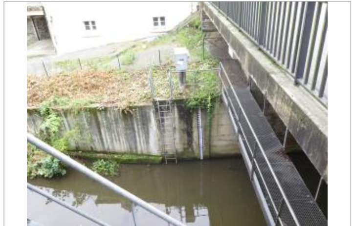
station limnimétrique de Vitré Bas Pont