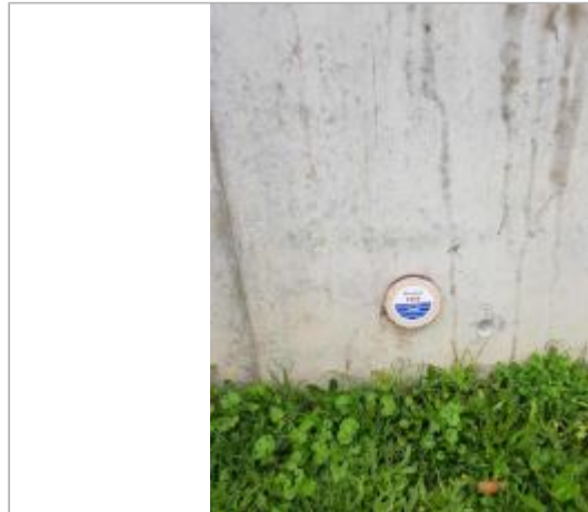
Point de repère