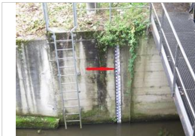
Echelle limnimétrique de la station de Vitré Bas Pont

SOURCE DE REPÉRAGE : SPC VILAINE COTIERS BRETONS - 08/12/2016