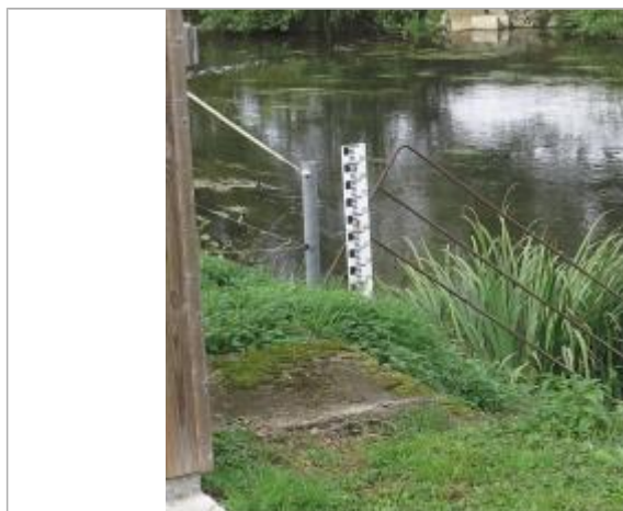
Echelle limnimétrique de la station de Pont Briand