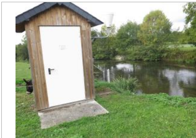
Vue générale de la station de Pont Briand à Cesson Sevigné

Coordonnées WGS84 : X: -1.56377250 / Y: 48.12375200