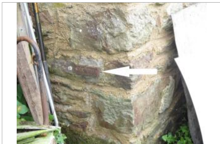
Plaque commémorative du niveau max de la crue de 1966

SOURCE DE REPÉRAGE : SPC VILAINE COTIERS BRETONS - 08/12/2016