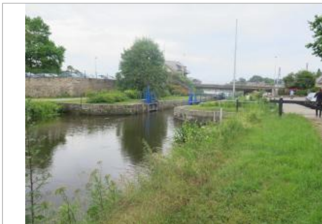
Vue générale du site à l'amont de l'écluse de Guipry