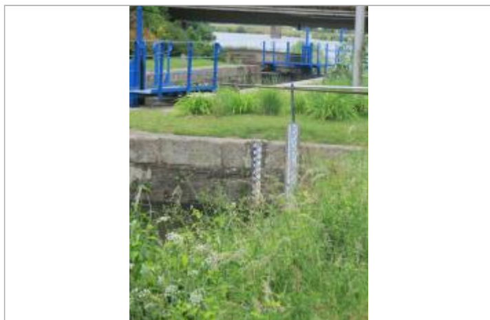
Echelle limnimétrique sur bajoyer amont de l'écluse de Guipry

Altitude calculée de l'eau (en m) : 8.392 m