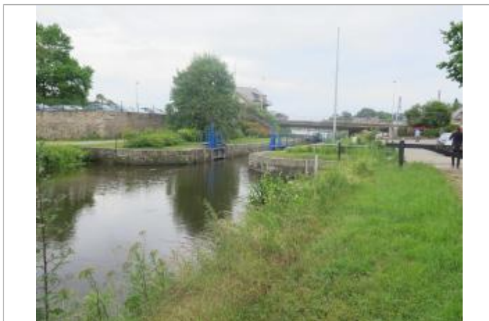
Vue générale du site à l'amont de l'écluse de Guipry