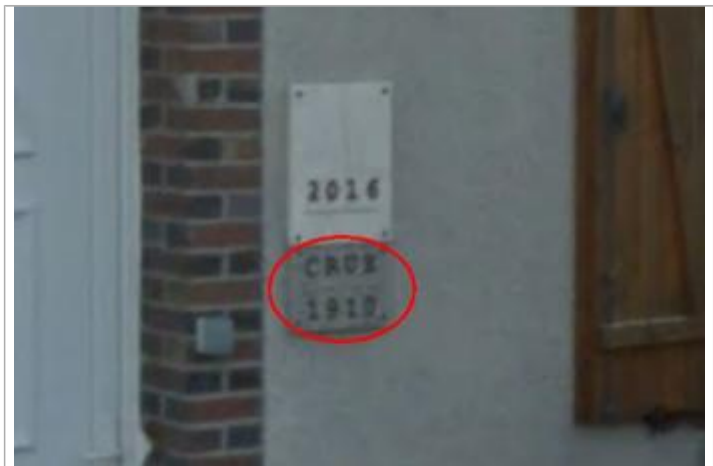
Vue de la marque 1910

MARQUE Texte : Crue 1910 Maximum de l'inondation : Oui Visibilité : Oui État du repère : Bon Pérennité : Longue