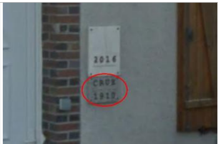
Vue de la marque 1910