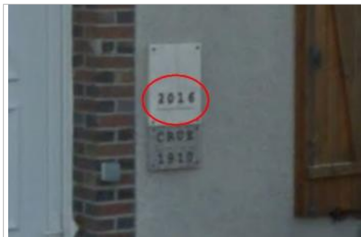
Vue de la marque 2016